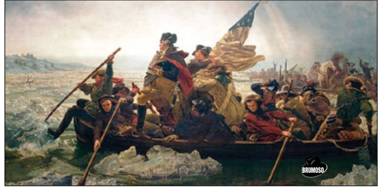
El General George Washington cruzando el río Delaware mientras guerreaba en contra de los británicos durante la guerra revolucionaria.

No fue hasta el 1968 que las cosas comenzaron a cambiar. En ese año, el congreso introdujo un proyecto de ley llamado Uniform Monday Holiday Bill, el cual aseguró que los días feriados fueran celebrados los lunes para aumentar la cantidad de fines de semanas largos. Como parte de este proyecto de la ley, el cumpleaños de Washington fue movido a el tercer lunes de febrero. En estos momentos, muchas personas comenzaron un movimiento en contra