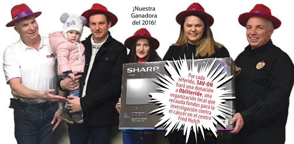
¡Nuestra Ganadora del 2016!